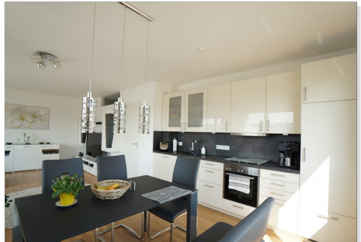
Wohnen / Essen / Kochen