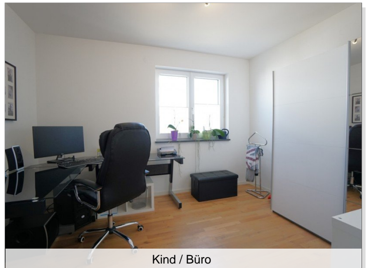
Kind / Büro