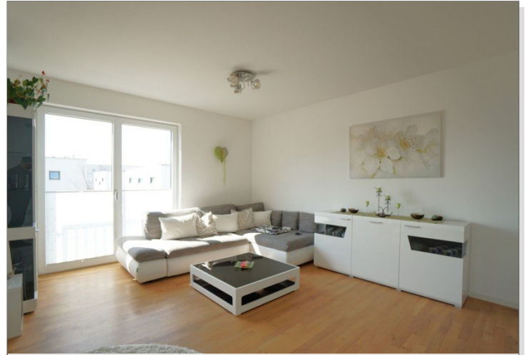
Wohnen / Essen / Kochen