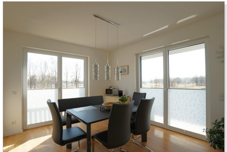
Wohnen / Essen / Kochen