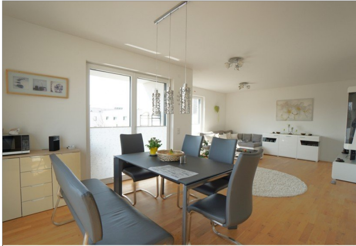
Wohnen / Essen / Kochen