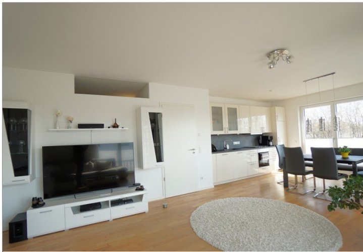
Wohnen / Essen / Kochen