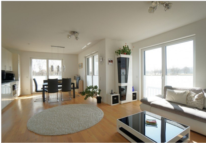
Wohnen / Essen / Kochen