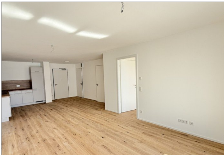
Wohnen / Kochen