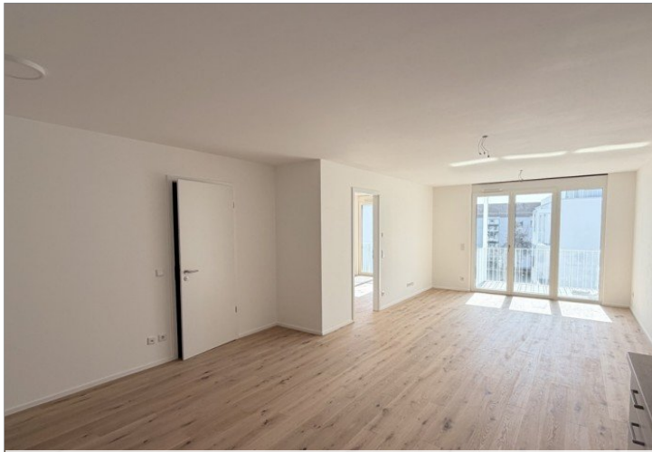
Wohnen / Kochen