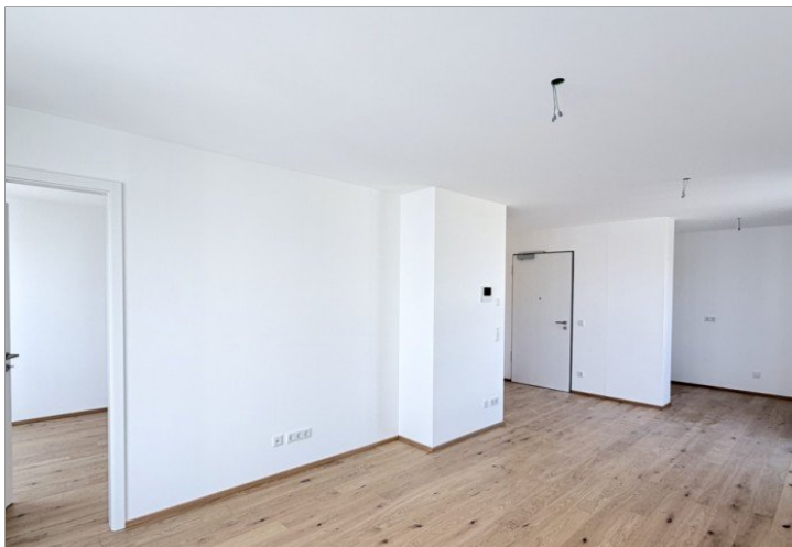
Wohnen / Kochen