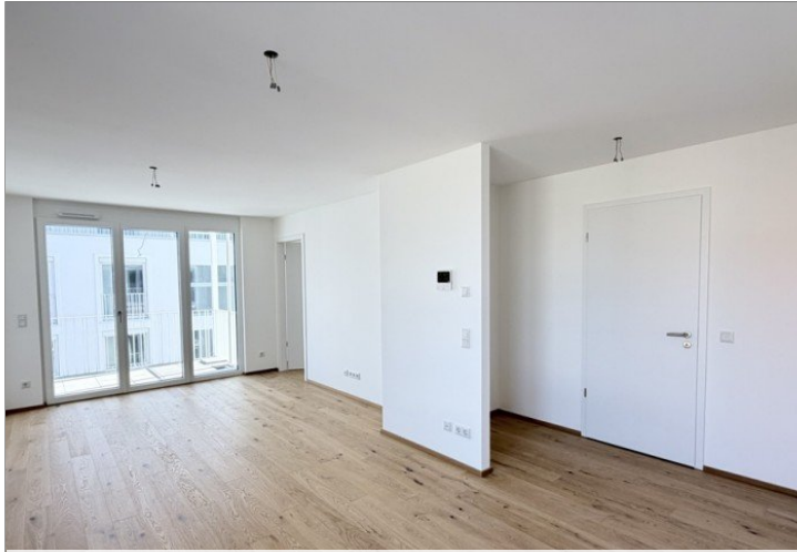
Wohnen / Kochen